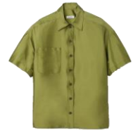
SFPCM00974 H23CACAO 245€ / 165€ £279 / £186