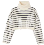
SFPPU02085 H23ARIEL 265€ / 178€ €299 / €200