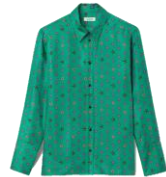
SFPCM00951 H23AFRANIE 265€ / 178€ £299 / £200