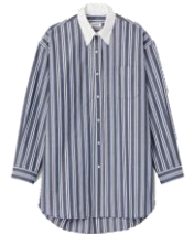
SFPCM00999 H23LEAN 225€ / 151€ £249 / £166