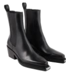
SFACH00986 H23SAILA 445€ / 299€ €499 / £334