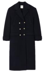
SFPOU00584 H23BETINA 575€ / 386€ £639 / £428