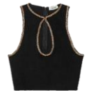
SFPPU02120 H23NAAM 165€ / 111€ €179 / £119