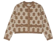
SFPCA00904 H23MONO 295€ / 198€ £329 / £220