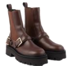
SFACH01022 H23HELEN 385€ / 258€ £429 / £287