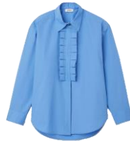
SFPCM00956 H23JANO 225€ / 151€ £249 / £166