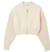
SFPCA00829 H23BAREY 275€ / 185€ £309 / £207