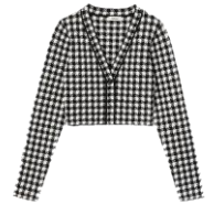
SFPCA00872 H23MEEL 195€ / 131€ €219 / €146