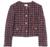
SFPVE00873 H23LOLA 375€ / 252€ £419 / £280