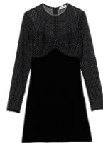
SFPRO03400 H23KARLIE 295€ / 198€ €329 / £220